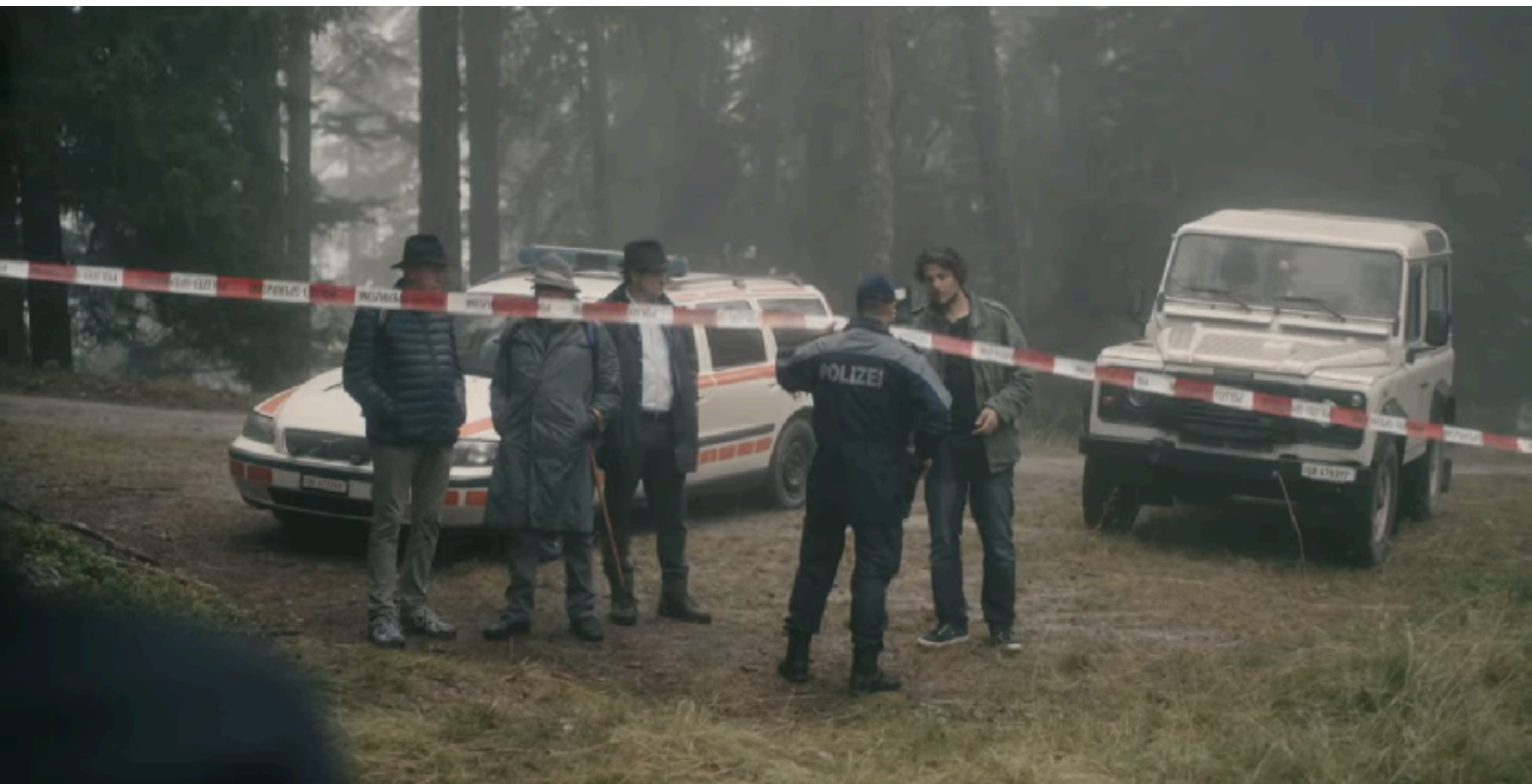
„Bernegger & Juric“ , Regie: Julius Bär, eine Produktion von 3Plus