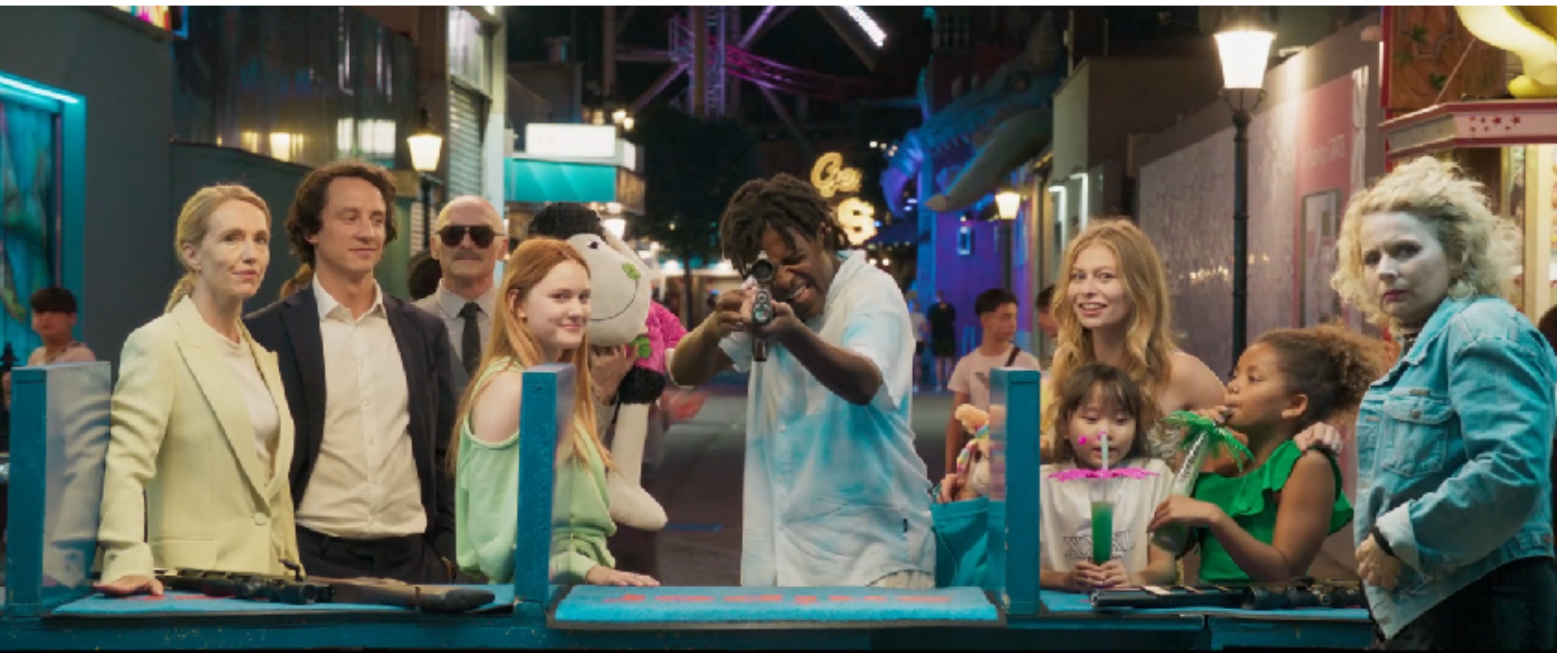
„VENI VIDI VICI“ - eine Ulrich Seidl Filmproduktion, Regie: Daniel Hoesel und Julia Niemann, Bestes Kostümbild - Österreichischer Filmpreis 2025